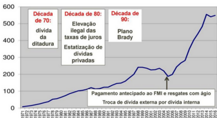
Dívida Externa (US$ bilhões)

A ACD analisou a legislação anterior à referida lei, estudos publicados e as Resoluções do Senado Federal de 1970 até 2012 e constatou que, com a chegada dos militares ao governo em 1964 são criadas as condições para o endividamento dos Estados.